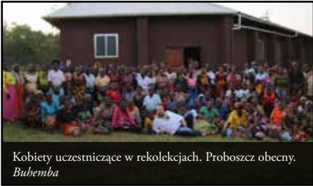
Kobiety uczestniczące w rekolekcjach. Proboszcz obecny. Buhemba

Pył i kurz, a podczas deszczowej pory błoto i ogromne deszcze. Po prawej i lewej stronie drogi rozciągające się pola uprawne kukurydzy, słodkich ziemniaków i fasoli. Domki kryte strzechą i pięknie wymurowane zabudowania. W nocy żarzące się w oddali światła