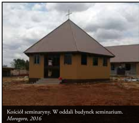
Kościół seminarny. W oddali budynek seminarium. Morogoro, 2016

Kopanie fundamentów rozpoczęło się w czerwcu, a już we wrześniu mogliśmy się wprowadzić i zainaugurować Dom Formacyjny Zmartwychwstania (Resurrection Formation House). Aktualnie składa się on z dwóch budynków, mieszkalnego oraz z kaplicy. Nadal, według aktualnych możliwości, urządzamy się tu kompletując potrzebne wyposażenie. W planach jest też dobudowanie jeszcze jednego budynku.