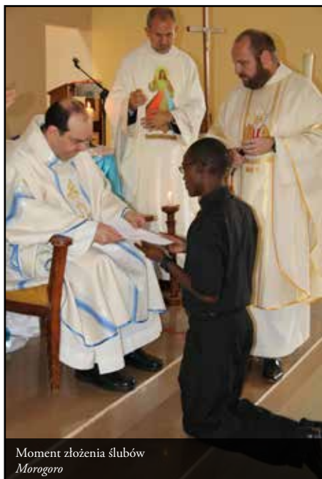
Moment złożenia ślubów Morogoro