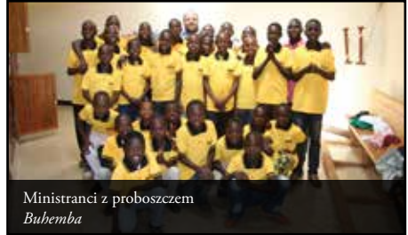
Ministranci z proboszczem Buhemba

Kolejnym elementem wyraźnego wpisania się w kulturę są elektroniczne dzwony Rduh, które wybijają każdą pełną